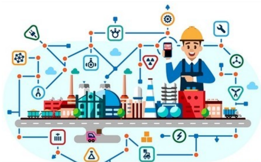
פיילוט סימביוזה תעשייתית לקראת סיום

לדברי משרד הכלכלה, בנוסף לעסקאות שנחתמו בפועל, קיימות מעל 250 עסקאות פוטנציאליות בשלבים שונים של הבשלה. עסקאות אלו עשויות למנוע הטמנה של מעל 1.2 מיליון טון פסולת, ולהביא לתועלות כלכליות ישירות של כ-60 מיליון ₪. עד כה גויסו במהלך הפיילוט מעל 350 עסקים ומופו מעל 1,700 זרמי פסולות.